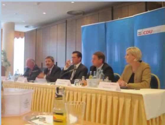
Karl-Theodor zu Guttenberg (M.) bei einer Veranstaltung zur Zukunft der Bundeswehr in Rostock

In dieser Woche haben sich die Präsidien von CDU und CSU geeinigt, die Strukturreform der Bundeswehr und die Aussetzung der Wehrpflicht zu unterstützen. Sie ist eine Armee im Einsatz – und braucht deshalb auch eine Struktur, die dies abbildet. Die sicherheitspolitischen Anforderungen an Deutschland verlangen reaktionsschnelle und multinational einsetzbare