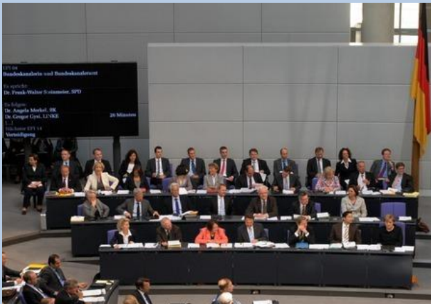
Die Regierungsbank während der Rede von Frank-Walter-Steinmeier

Themen: Haushalt 2012 – Europa in der Krise