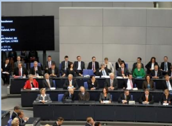
Regierungsbank am 15. September bei der Generaldebatte über den Kanzler-Etat

die vergangene Sitzungswoche, die erste nach den Parlamentsferien, stand ganz im Zeichen des Haushalts 2011. Die christlich-liberale Koalition plant nicht weniger als einen Wendepunkt in der Haushalts- und Finanzpolitik des Bundes. Wir wollen erstens die Schuldenbremse einhalten, die das Grundgesetz vorschreibt, zweitens den Wirtschaftsaufschwung bewahren und drittens die Ausgaben reduzieren, um Arbeit attraktiver zu machen.